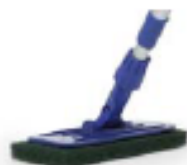
Padhalter mit Teleskopstiel Durch das Doppelgelenk ist der Padhalter in jede Richtung beweglich. Die Befestigung der Pads basiert auf dem Klettprinzip.