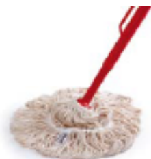
Twist Mop von Vileda Professional aus 100% Baumwolle. Der Systemmop mit Aus- wringmechanik ist ideal für Holzbodenseife und Reiniger.