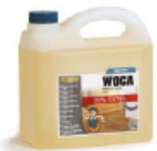
WOCA Holzodenseife Reinigt und schützt Fuß- böden aus Holz, ohne sie auszulaugen. Verwenden Sie WOCA Holzodenseife Weiß für weiß geölte Böden.