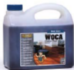
WOCA Meister Bodenöl Meister Bodenöl für eine natürlich schöne und robuste Holzoberfläche.