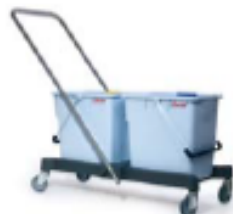
Zwei-Eimer System Zwei 15 bzw. 25l Eimer, jeweils einen für Holzodenseife-Lösung und Schmutzwasser