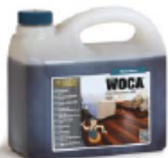
WOCA Pflegeöl zur Pflege, Renovierung und Auffrischung von geölten Böden.