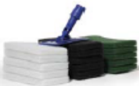
Passende Pads Verwenden Sie schwarze Pads für die Reinigung der Holzoberfläche und grüne Pads zur Grundbehandlung. Weiße Pads werden zum Nachpolieren verwendet.